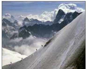
Aufstieg zum Mont Blanc

Durchführung aller Terminveranstaltungen unter Vorbehalt! näheres siehe Homepage www.dav-nahegau.de