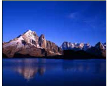
Aiguille Verte und Aiguille du Dru