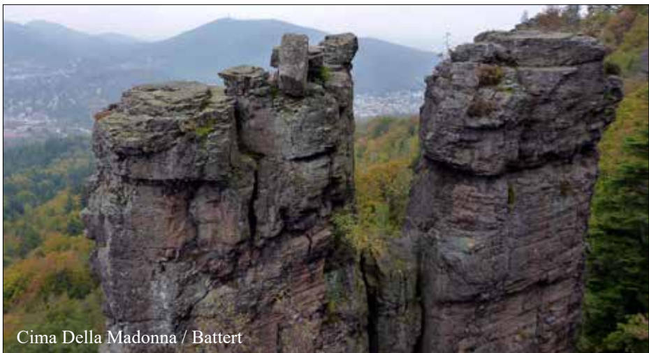
Cima Della Madonna / Battert